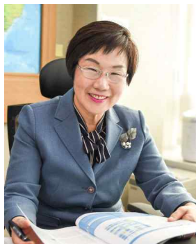
KOICA(한국국제개발협력단, Korea International Cooperation Agency) 이미경 이사장